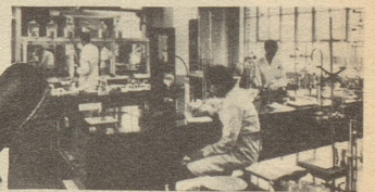
Teilansicht aus dem Forschungszentrum der Silvikrin-Laboratorien in London, wo ein ganzer Stab von Chemikern, Dermatologen und Wissenschaftlern beschäftigt wird.

Neo-Silvikrin enthält alle 18 Aufbaustoffe des Haares , einschließlich Tryptophan, und hat eine wahre Revolution in den Methoden der Haarpflege verursacht. Die Erfolge sind erstaunlich: Leute, die jahrelang an Schuppen gelitten haben, waren innerhalb weniger Wochen davon befreit. Der Haarausfall war in einigen Monaten behoben und neues Wachstum setzte ein.