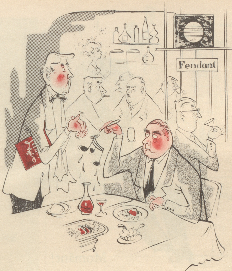
Die Tonberieselung in Gaststätten