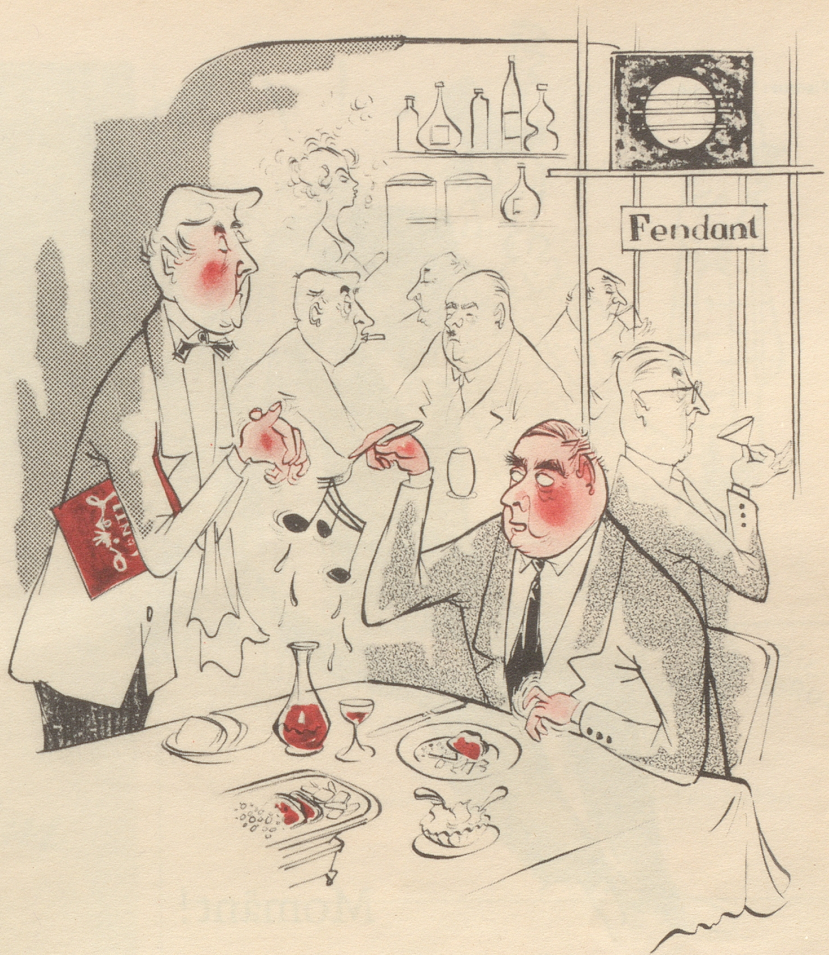
Die Tonberieselung in Gaststätten