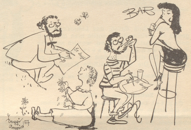
Lenzgedicht einst und jetzt