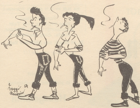
Probleme der Halbstarcken