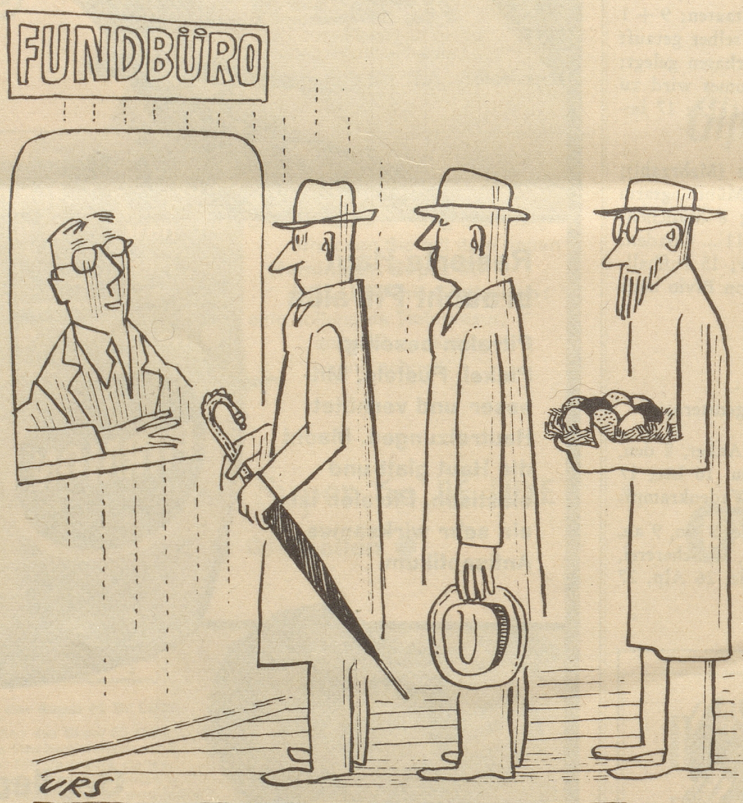
Ehrlicher Mann hat in seinem Garten Ostereier gefunden