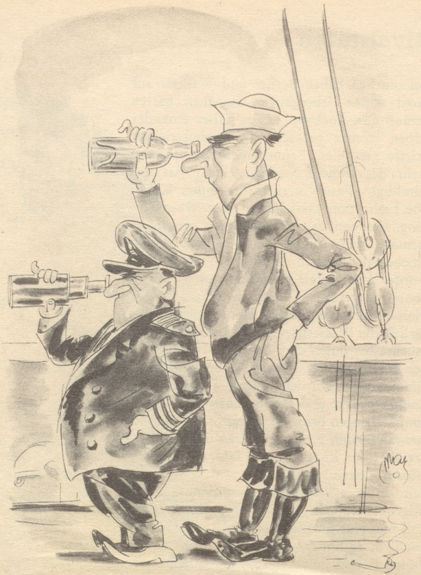
«Was siehst du, Maat?»