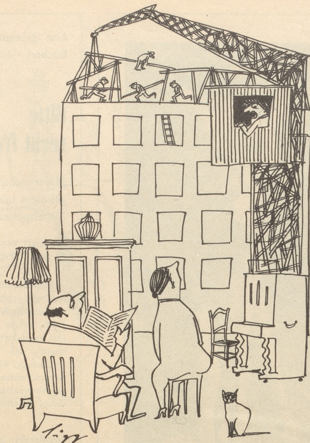
Menschen, die auf ihre Wohnung warten --