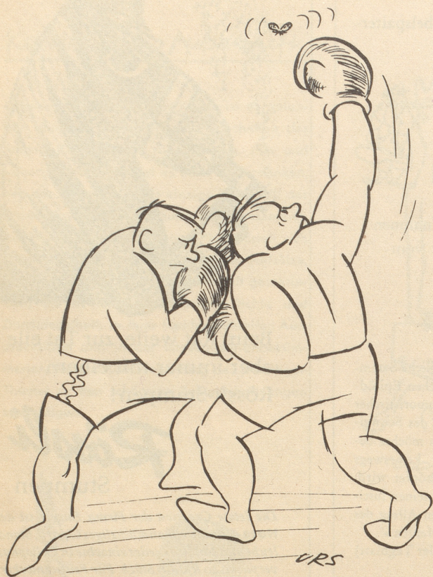
Mangel an Konzentration