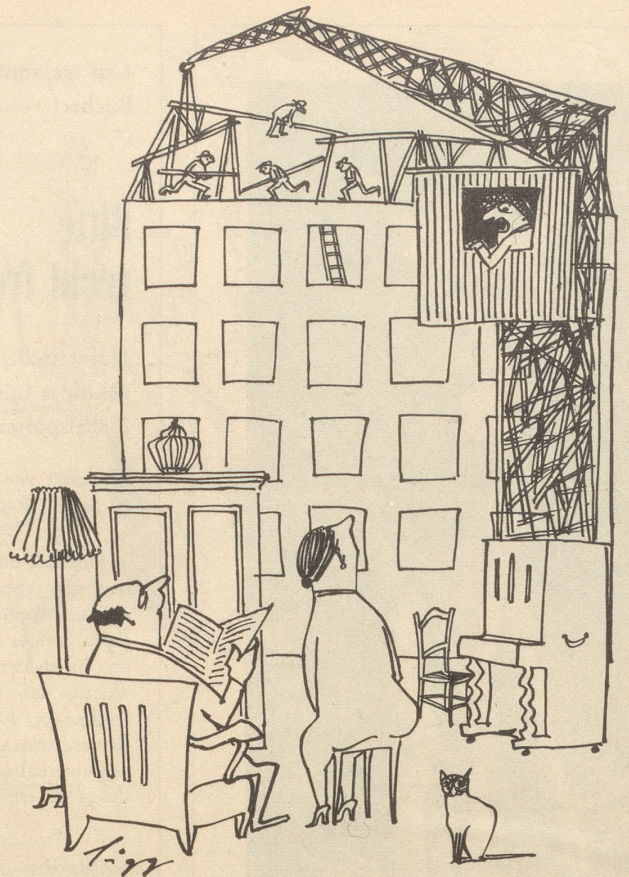
Menschen, die auf ihre Wohnung warten --