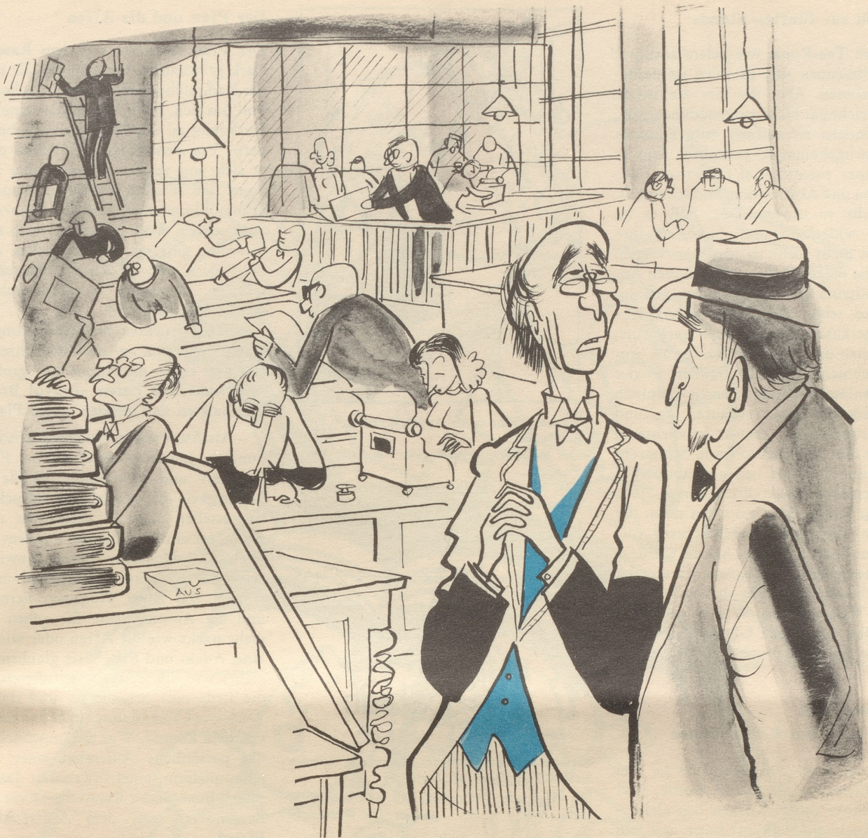
In der Volksdemokratie