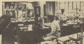
Teilsicht aus dem Forschungszentrum der Silvikrin-Laboratorien in London, wo ein ganzer Stab von Chemikern, Dermatologen und Wissenschaftlern beschäftigt wird.

Neo-Silvikrin enthält alle 18 Aufbaustoffe des Haares , einschließlich Tryptophan, und hat eine wahre Revolution in den Methoden der Haarpflege verursacht. Die Erfolge sind erstaunlich: Leute, die jahrelang an Schuppen gelitten haben, waren innerhalb weniger Wochen davon befreit. Der Haarausfall war in einigen Monaten behoben und neues Wachstum setzte ein.