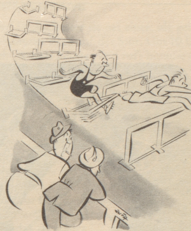
«Wenn es danach geht, wer die meisten umwirft, wird der Schwarze Sieger!»