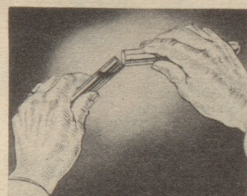
Jeder Chemiker kann das Vorhandensein des Tryptophan im Neo-Silvikrin mit Hilfe der Glyoxylsäure und H 2 SO 4 feststellen.