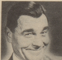
«Kein Spaß zuzusehen, wie einem die Haare ausfallen», sagt Herr D. «Seitdem ich Silvikrin verwende, fallen meine Haare nicht mehr aus und auch die Schuppen sind weg.»