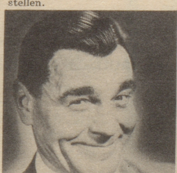
«Kein Spaß zuzusehen, wie einem die Haare ausfallen», sagt Herr D. «Seitdem ich Silvikrin verwende, fallen meine Haare nicht mehr aus und auch die Schuppen sind weg.»