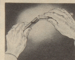
Jeder Chemiker kann das Vorhandensein des Tryptophan im Neo-Silvikrin mit Hilfe der Glyoxylsäure und H 2 SO 4 feststellen.