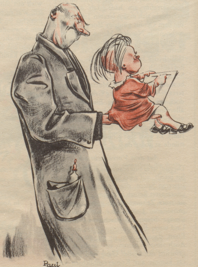
Genie wird aufgepäpelt