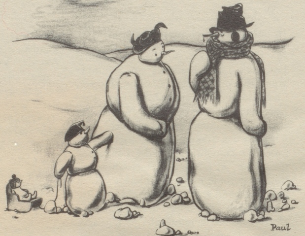
«Bin sehr erkältet!»

Für die raue Jahreszeit besonders empfohlen