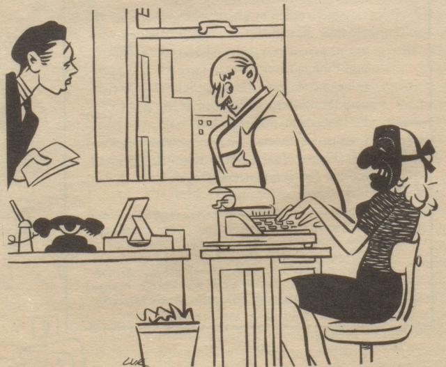
«Sie ist so hübsch, daß ich ihr nur auf diese Weise mit Konzentration diktieren kann!»

Rheuma, Gicht, Arthritis, Hexenschuss, Ischias, Schmerzen in den Gelenken und Gliedern, allen Arten von Kopf- und Nervenschmerzen, Erkältungskrankheiten. Togal-Tabletten lösen die Harnsäure und bewirken die Ausscheidung der schädlichen Krankheitsstoffe. Ueber 7.800 Aerzte aus 38 Ländern bestätigen die hervorragende, schmerzstillende und heilende Wirkung von Togal. Klinisch erprobt und empfohlen. Nehmen Sie daher vertrauensvoll Togal; es wird auch Ihnen helfen! Zur Einreibung das vorzüglich wirksame Togal-Liniment! In Apotheken und Drogerien.