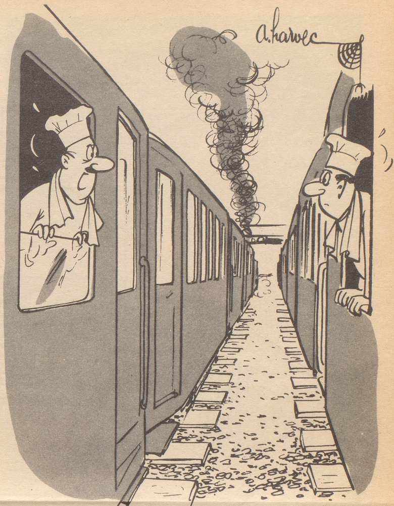
Speisewagen kreuzen sich