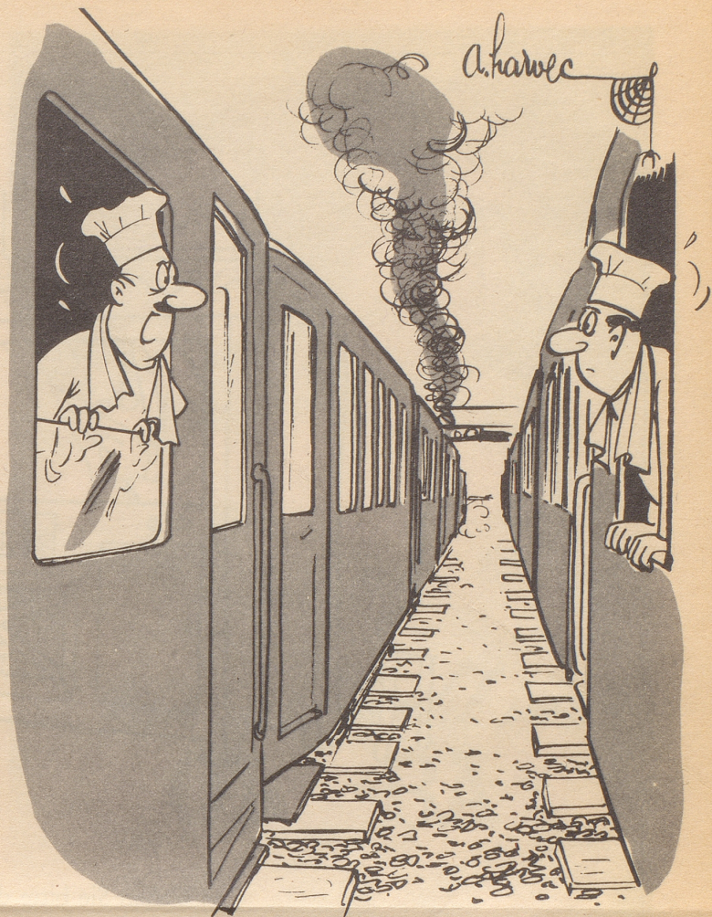
Speisewagen kreuzen sich

könnte man die folgende wahre Geschichte nennen. Der frühere amerikanische Soldat McHale stand vor dem Polizeirichter in Montreal, weil er angeblich versucht hatte, durch ein Fenster in die Wohnung einer Dame einzusteigen. Mit einem Schreckensschrei war die Dame zurückgefahren, als sie den unbekannten Mann im Fenster erblickte, der sich anschickte, sich in ihr Zimmer zu schwingen, und hatte die Polizei alarmiert. Im Verlauf seiner Verteidigung, die durch seine Freundin bestätigt wurde, gab McHale bekannt, daß er keineswegs einen Einbruch geplant hätte. Er wollte nur nach längerer Abwesenheit von Montreal wieder sein Girl besuchen und seitdem er in Bayern das «Fensterln» gelernt hatte, praktizierte er seine Besuche nur auf diesem Wege. Inzwischen hatte aber seine Freundin die Wohnung gewechselt und so hatte er sich einer wildfremden Dame gegenüber gesehen, die ihrerseits an seinen ehrlichen Absichten gezweifelt hatte. Michel