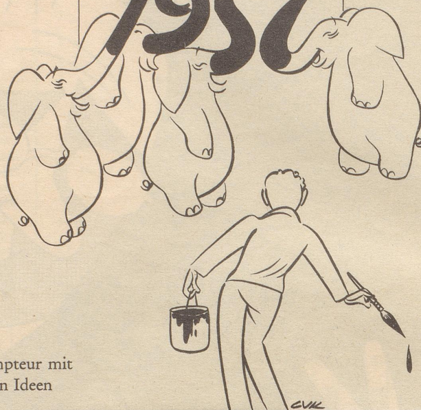
Dompteur mit neuen Ideen