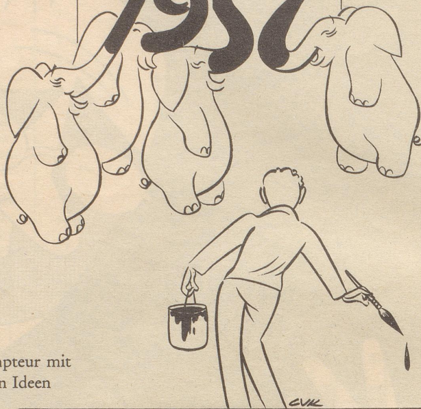
Dompteur mit neuen Ideen