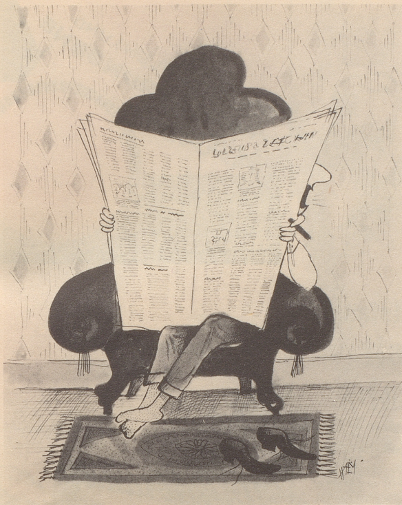
Es Schtückli Schwiz « Emmeli bring mer Pfinke! »