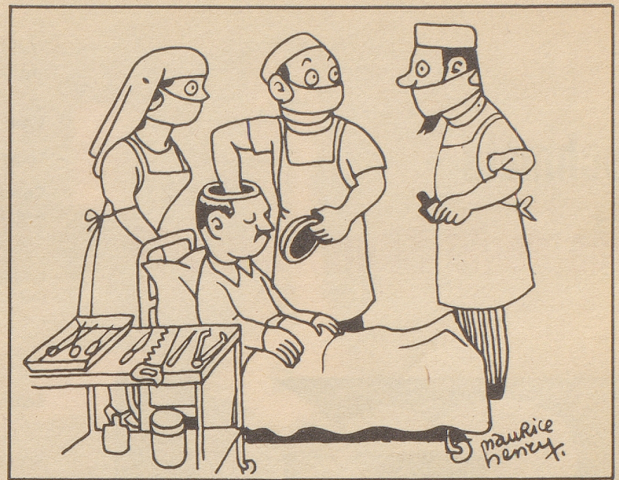
«Ich glaube, wir versuchen es da besser mit der Psychoanalyse.»

Senator Knowland, einer der maßgebenden Politiker der republikanischen Partei Amerikas, hat in einem Fernseh-Interview ohne mit der Wimper zu zucken erklärt, er werde der UNO Sanktionen gegen Frankreich, Großbritannien und Israel vorschlagen, wenn diese Länder nicht unweigerlich ihre Truppen aus Aegypten zurückziehen. Auf die Frage, was geschehen solle, wenn Aegypten Schwierigkeiten machen würde, erwiderte er, der Fragesteller habe «den Karren vor das Pferd gestellt». Senator Knowland hat wohl erkannt, daß es eine unverantwortliche Brückierung der ganzen arabischen Welt wäre, eine Frage zu diskutieren, die Möglichkeit in Betracht zieht, Herr Präsident Nasser könnte irgend etwas Unrechtes tun. E. L., Basel