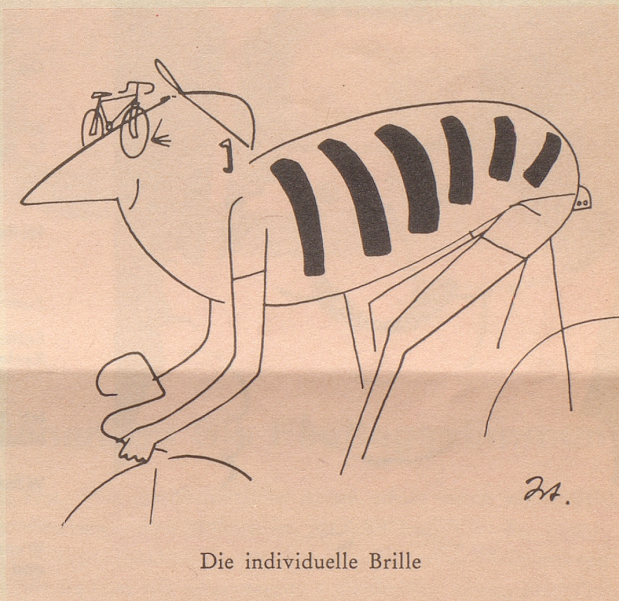
Die individuelle Brille