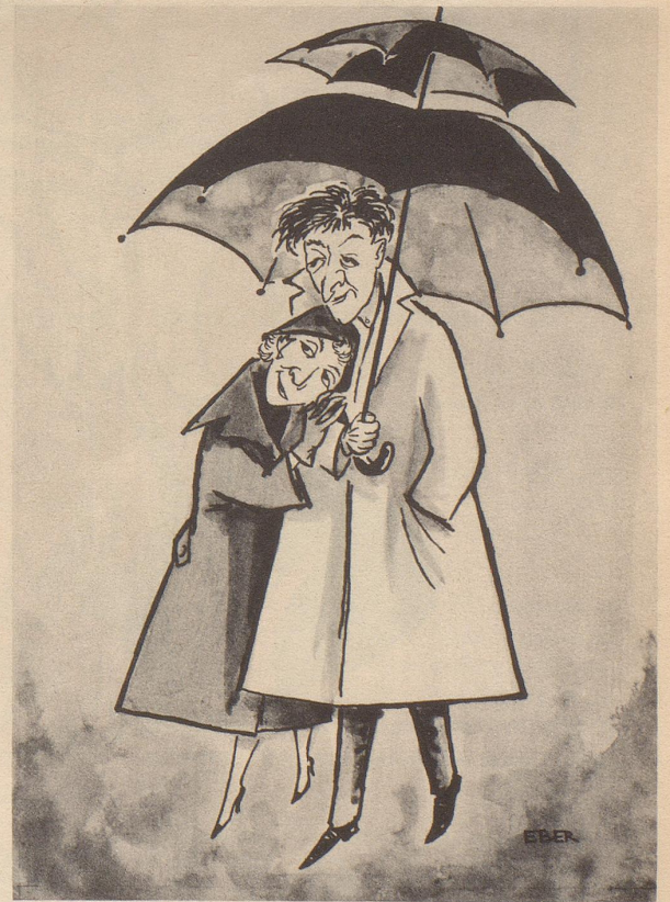
Aus unserer Erfindermappe Lösung des Schirmproblems der Verliebten