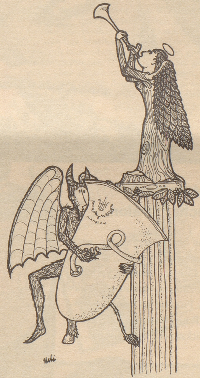
Der Teufel bläst das stärkere Instrument!