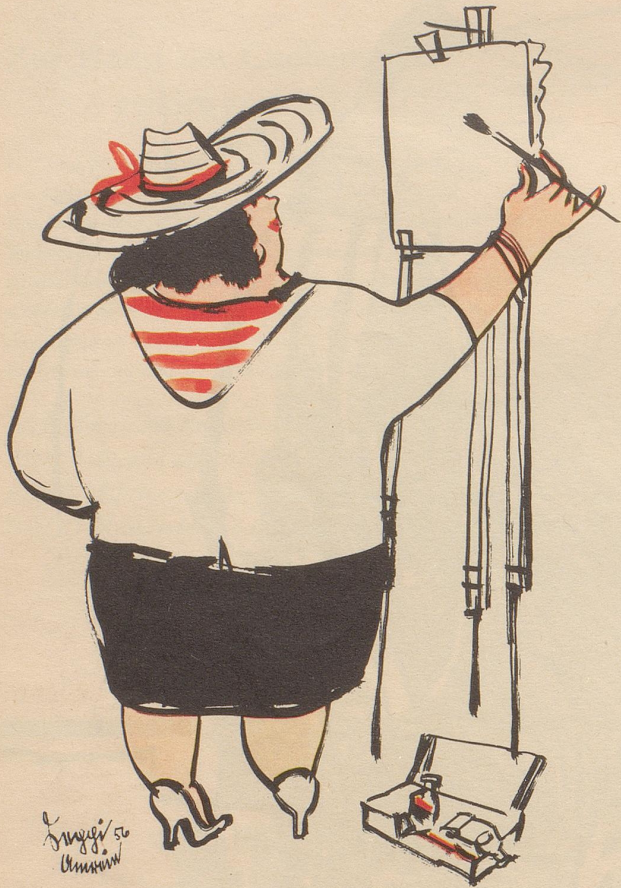
Noch ist nichts passiert!