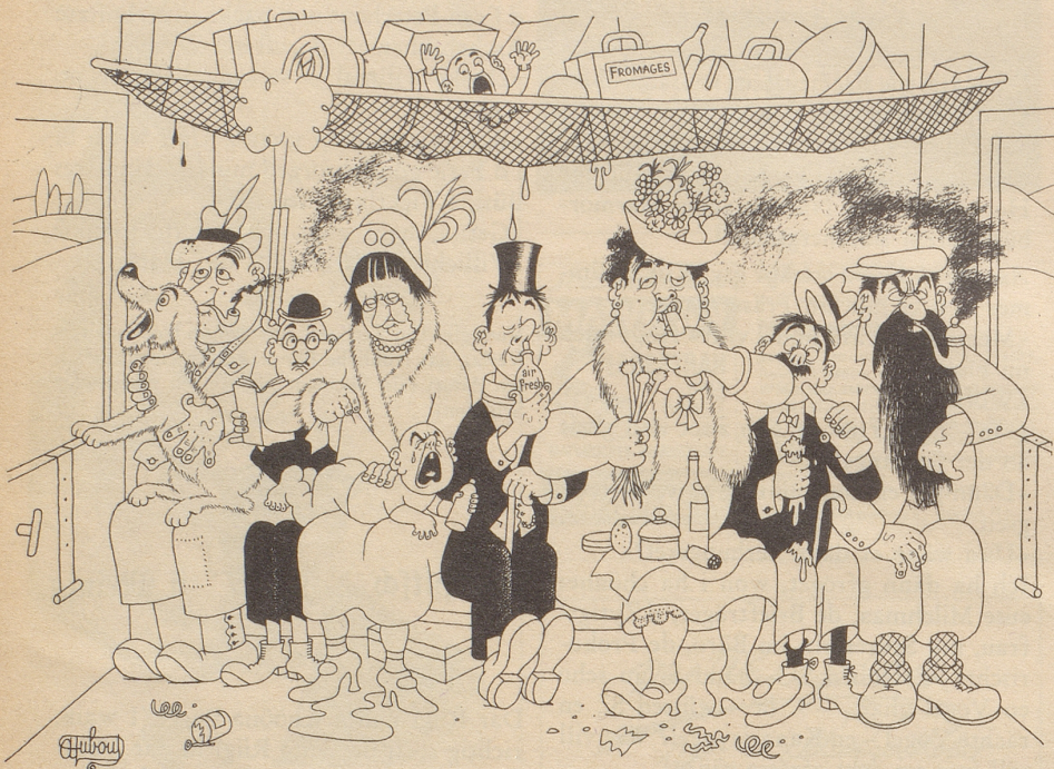
Ein Glück, daß es air-fresh gibt