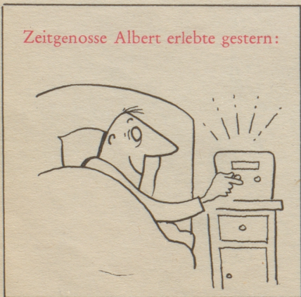
Zeitgenosse Albert erlebte gestern:

Ich empfand es wohltuend, wie hier einer über sich selber hinauswuchs und seine Unehrllichkeit so klaren Auges einsah und ich schloß: «Ist es nicht so, daß gerade der am richtigen Orte und zu gegebener Stunde wahrhaft ernst sein kann, der auch am richtigen Orte und zu gegebener Stunde wahrhaft unverkrampft heiter zu sein vermag?»