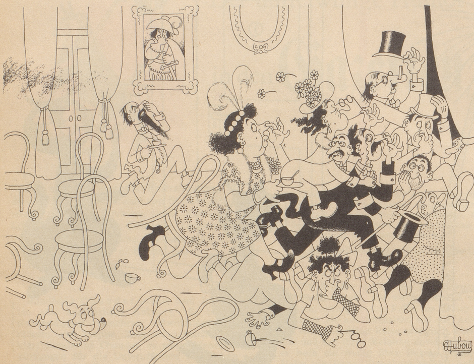
Der Gastgeber hat air-fresh vergessen!