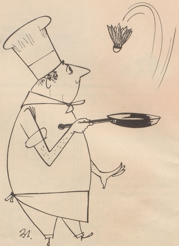
Das Kind im Manne