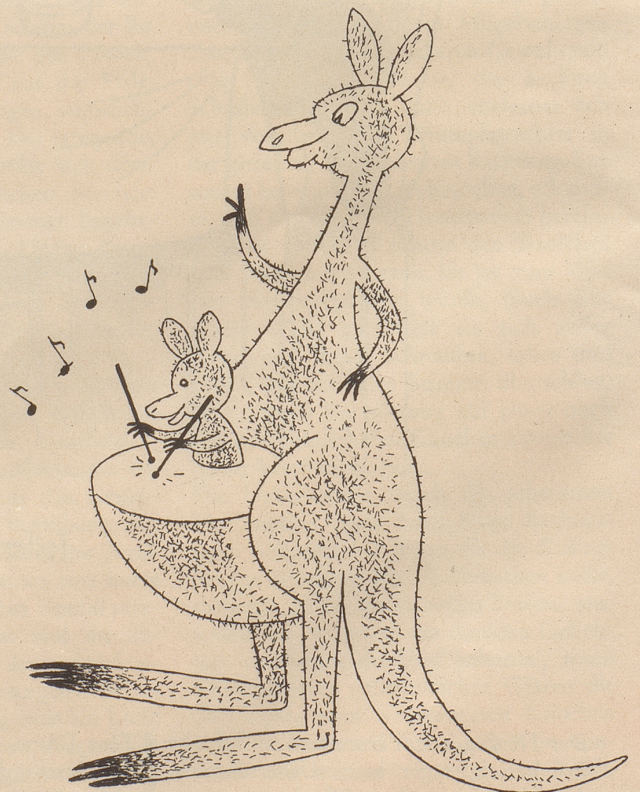
Im Basler Zolli