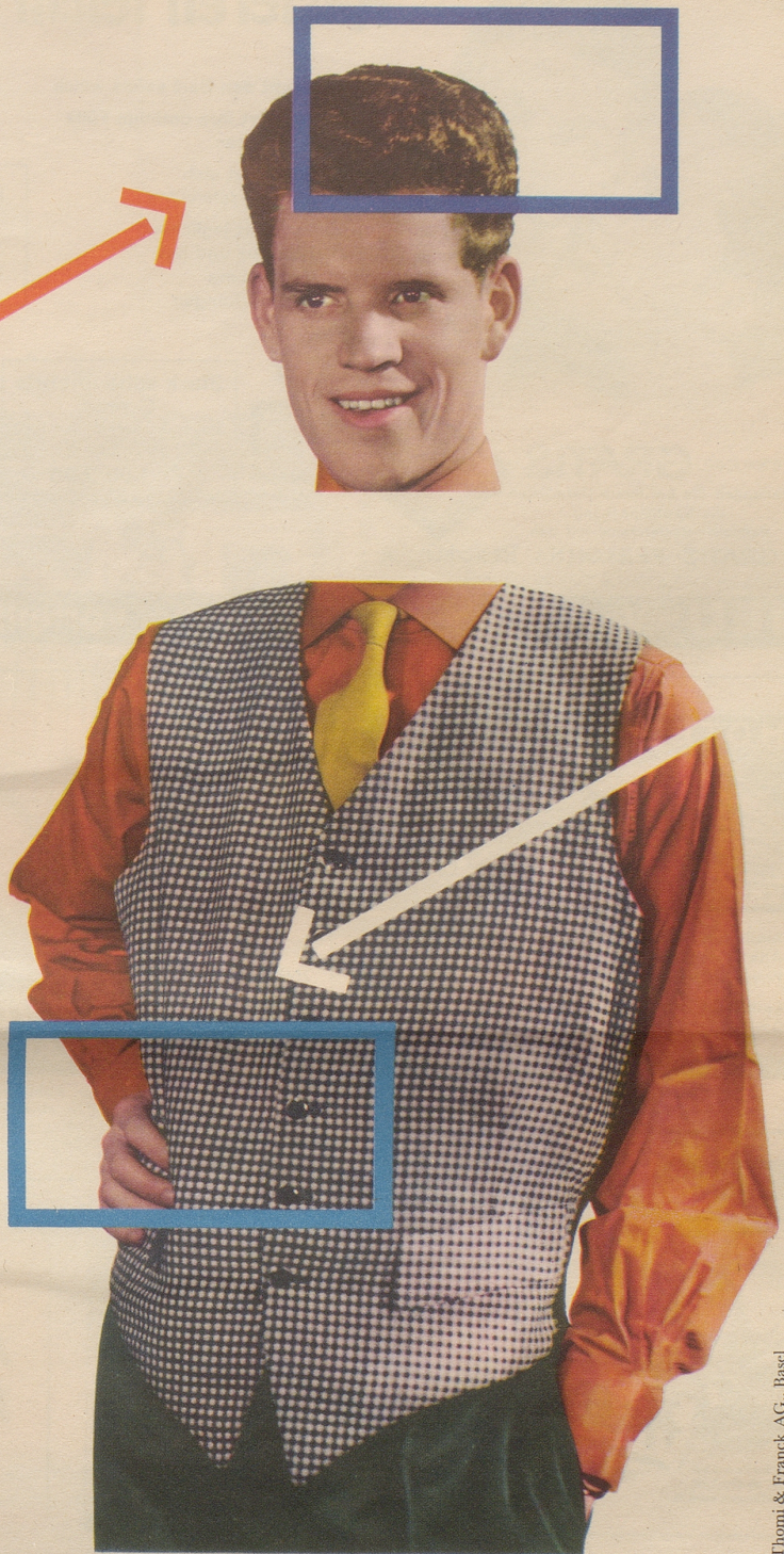
Thomi & Franck AG., Basel

Eine Kleinigkeit! Man muss den Milchkaffee richtig zubereiten: zum Kaffeepulver ein Drittel Franck Aroma, damit er tiefbraun und kräftig wird. Solch würziger Kaffee gibt mit der Milch zusammen den richtigen, rassigen Milchkaffee.