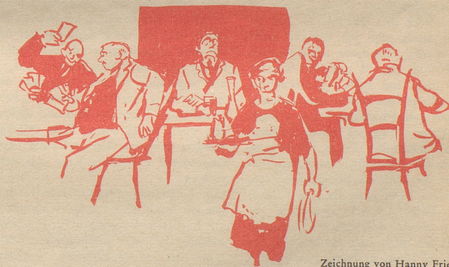
Zeichnung von Hanny Fries

Der Friedensrichter versuchte vergeblich, den Streit zu schlichten. Der Stehkragenmann konnte sich zu keinem Vergleich entschließen, obwohl die Jasser ohne weiteres bereit gewesen wären, alles mit dem Ausdruck des größten Bedauerns zurückzunehmen. Die Wunde saß zu tief. Ein ehrliches Schweizergericht sollte darüber urteilen, ob man einen ehrlichen Schweizer Papierlischweizer, nachgedunkelten Schrumpfergermanen und schlechten Schweizerbürger nennen dürfe,