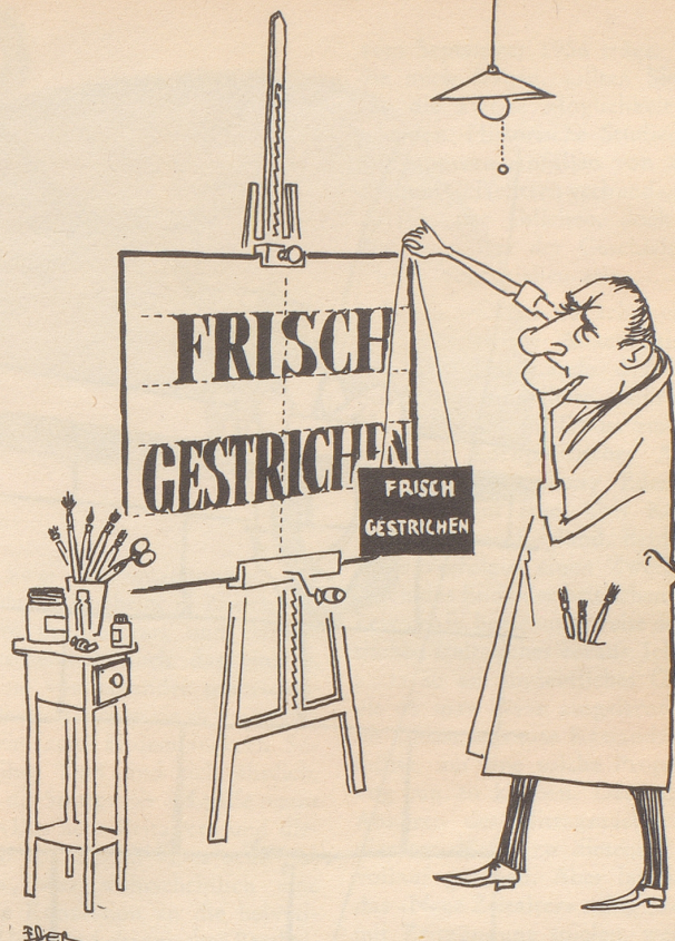
Der vollkommen Vorsichtige