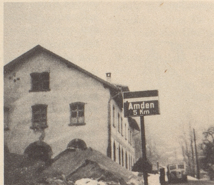
Von Amden nach Weesen zurück aber

Als langjähriger und eifriger Leser bitte ich Dich um Deine Beihilfe. Ich habe bei einer Fahrt nach Amden trotz hellem Sonnenschein einen Nebel entdeckt, den ich ohne Dich nicht wegbringen kann. Laut den angebrachten offiziellen Ortstafeln ist nämlich die Distanz von Weesen nach Amden: