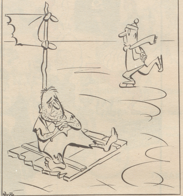
Er hat nicht bemerkt, daß es Winter geworden