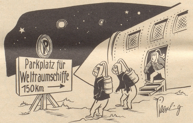
«Das glaubt uns unten kein Mensch! ...»

Hitzewunsch eines Touristen: Mit dem neugewählten Präsidenten der Republik in die Wüste gehen, damit der Nasser trockner wird. bi