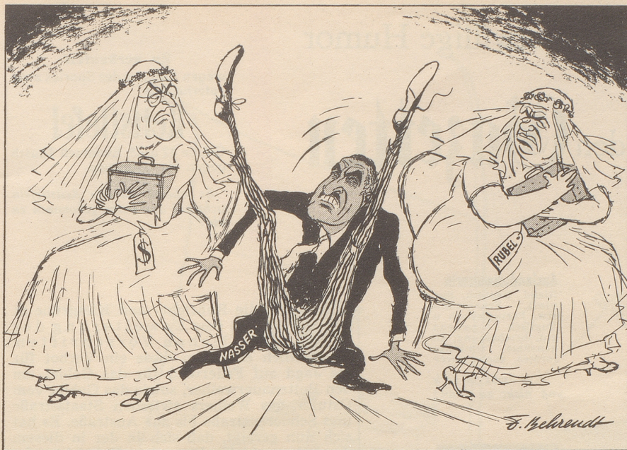
Zwischen zwei Stühlen