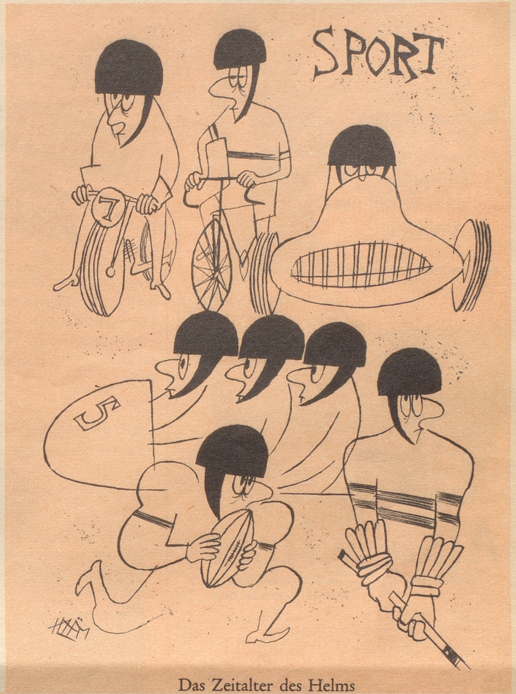
Das Zeitalter des Helms