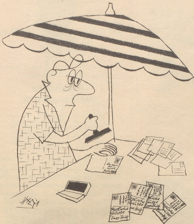
Der Stempel mit den Feriengrüßen