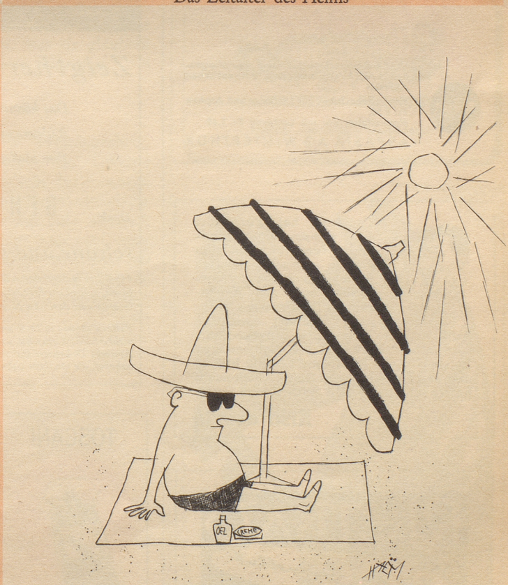
Genieße die Sonne. Aber schütze dich mit allen zu gebotstehenden Mitteln gegen sie!