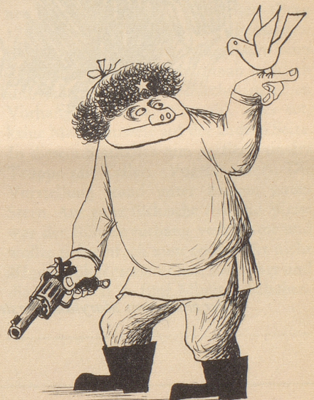
Semjenon Friedenkowitsch Friedow aus Stalino, der Entdecker des Kampfes für den Frieden