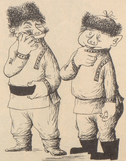
Ante Fingerlutschow Kaugummowitsch, Erfinder des von den Amerikanern gestohlenen geistreichen Gesellschaftsspielles