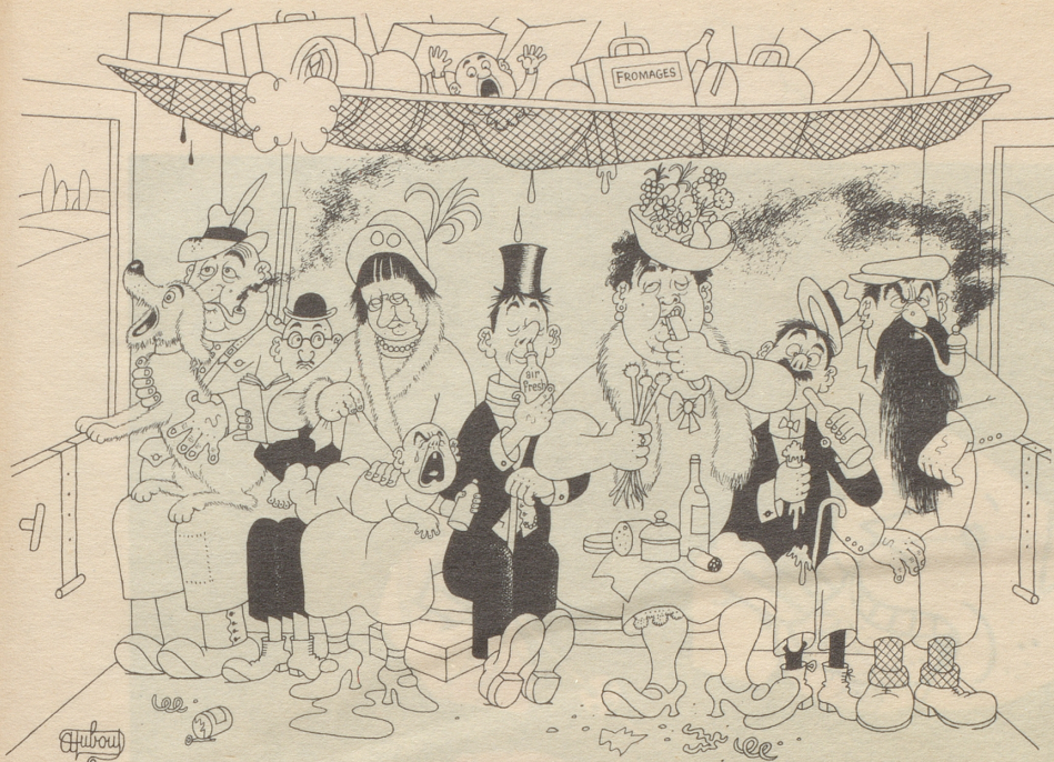
Ein Glück, daß es air-fresh gibt