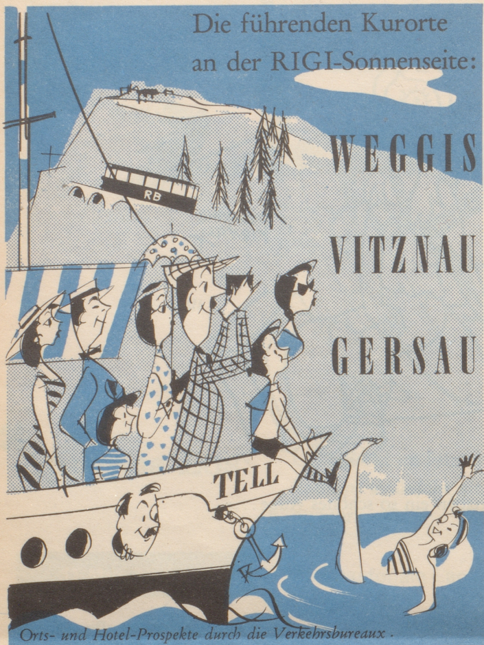
Orts- und Hotel-Prospekte durch die Verkehrsbureaux.

Die führenden Kurorte an der RIGI-Sonnenseite: