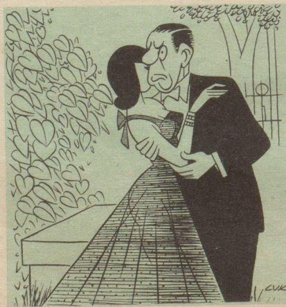
«Sie erinnern mich an einen Mann, den ich sehr lieb hatte. Es war mein Großvater.»

Alles Nächtliche war, wie gesagt, dem Obersten ein Dorn im Auge. Wie er seine