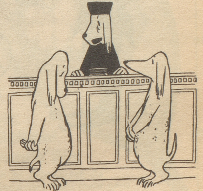
«Zum letztenmal: Haben Sie zu dem Kläger «Du Mensch» gesagt oder nicht?»