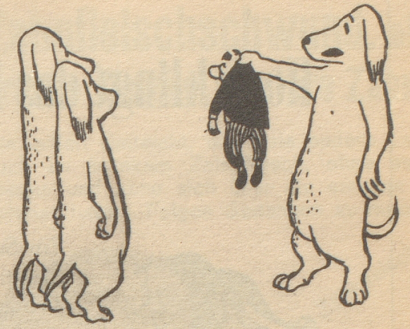
«Menschen faßt man so an!»