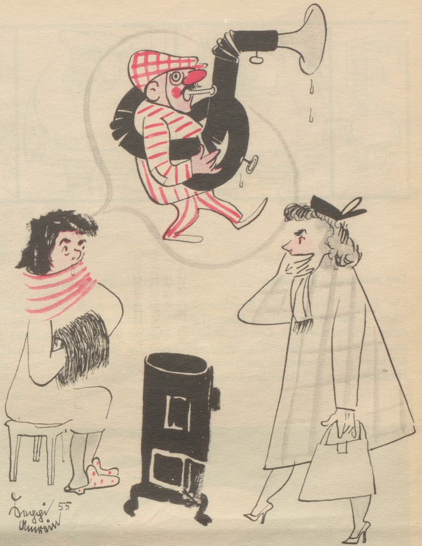
«Aber Schuggi, du friersch jo, kash denn nid haize?» «Ebe nit. My Ma isch doch bi dr Guggemuusig.»