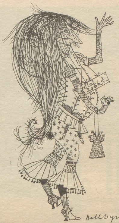
Alti Dante — ganz modern