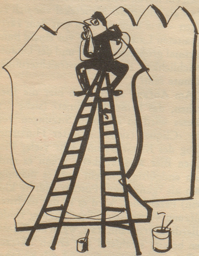
Vignetten von Max Sulzbachner

Was dann folgt, ist die Uebertragung des Entwurfes auf die Laterne selbst – ein kleinerer Amoklauf, wobei der «endgültige» Entwurf natürlich bis zur Unkenntlichkeit abgeändert wird. Aeufserst beliebt sind in diesem Zeitpunkt heiter ge-