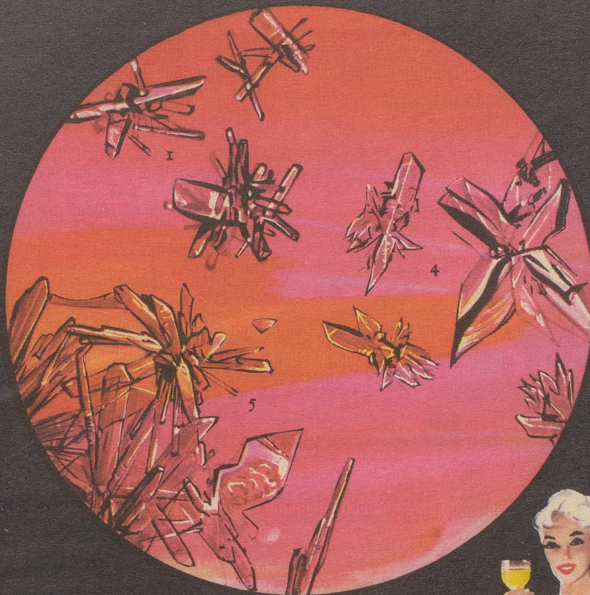
Mikrobild der wertvollen Nähr- und Aufbaustoffe des Traubensaftes, in Kristallform, 400-800-fach vergrössert: 1 Traubenzucker, 4 Fruchtsäure, 5 Kalium phos.