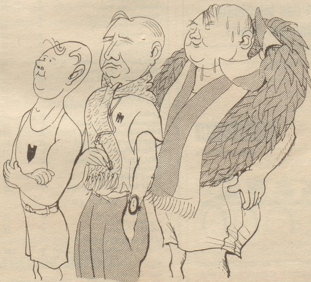
Steigerung: Sportler – Sportlehrer – Sportlerehrung