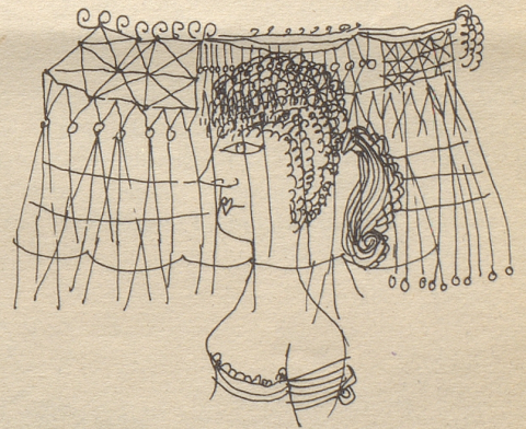
Für die Flitterwochen in der Sahara