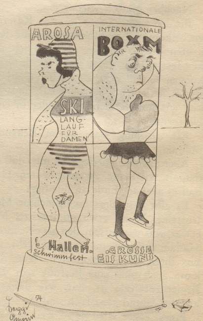
Sport an der Plakatsäule

Saßen wir da nicht als kleine Mädchen auf einer harten Schulbank und zählten 1, 2, 3, dann ein Kreuz? 1, 2, 3, dann ein Kreuz? Und entstand so nicht ein Saum an einem altmodischen Turnkleid? Welche Katastrophe war es doch, wenn man sich einmal verzählte. Da mußte aufgetrennt werden, bis zu jenem ominösen Faden zurück, den man zuviel oder zuwenig gezählt hatte. Es war geradezu eine Weltkatastrophe. Und heute können Vulkane ausbrechen, Atombomben platzen, die kleinen Mädchen sitzen zusammengekauert auf ihren Bänken und zählen 1, 2, 3, dann ein Kreuz. Nur daß sie heute ihre armen Augen viel stärker anstrengen müssen, denn laut wissenschaftlichem Befund werden ja unsere Augen nicht besser, sondern schlechter, durch die Anhäufung dessen, was wir ihnen zumuten. Und mit Tränen zählt man auch noch die Stiche genau ab, so als gäbe es noch keine Nähmaschinen, die ein Mädchen schon in der 3. Klasse bedienen könnte, weil wir ja im technischen Zeitalter leben. Auch der Maschinenstichsocken ist noch der gleiche wie vor 25 Jahren. Das Turnkleid immer