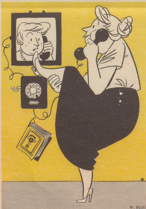
In San Francisco ist das Telefon mit dem Fernsehschirm bereits in Betrieb.

glääsa und glääsa, as hättna sälbar gintaressiart, wia das Gschichtli uusgengi ... Also, dar Sohn hätt müassa erfaara, daß dia Roß bejm Brand vum vätterliha Schloß umgschtanda sejand, am gliiha Tag, woma siina Vattar beärdigt hej. «Bhüetisch», rüaft dar Sohn: «Dar Vattar toot? Wiasoo denn au? Und wia goots miinara Schwöschtar?» – Und Khuani, sälbar gschpannt wiana Räägaschirm, hätt witar glääsa: «Drum eben hat sich Ihr Herr Vater seliger zu Tod gegrämt, als Ihre Jungfer Schwester ein Kindlein gebar und » – – Khuani isch mit dan Augen a bitz voruus gsii und gsächt wia dä Satz witargoot: «... und hatte keinen Vater dazu!» Z Bluat isch am Khuani in da Grind uffggeschossa. Är hätt aagfanga schtöttara, hätt dä Satztail überschrunga und mitam Heebel gsaid: «Es ist ein Büblein. Sonst gibt es just nicht viel Neues.» Färtig. Khuani isch au färtig gsii. Är hätt nu no khönna gwaggla: «Dar Vattar, dar Vattar, hetti äh, hetti villichtar villichtar liabar a – Maitali khaa ... Nemmand z Heft vürra und fangand aa schriiba!» Wia schu gsaid, mengmool isch dar Schualmaishtar guat vorberaitat, und mengmool a bitz wenigar – as sind halt au nu Mentscha!